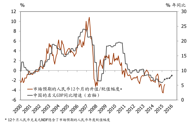
图表2：人民币贬值预期与中国经济增长息息相关